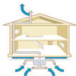
Drainage du radon par mise en dépression du sol sous-jacent au bâtiment.

Les principes des techniques visant à diminuer la présence de radon dans les bâtiments consistent :