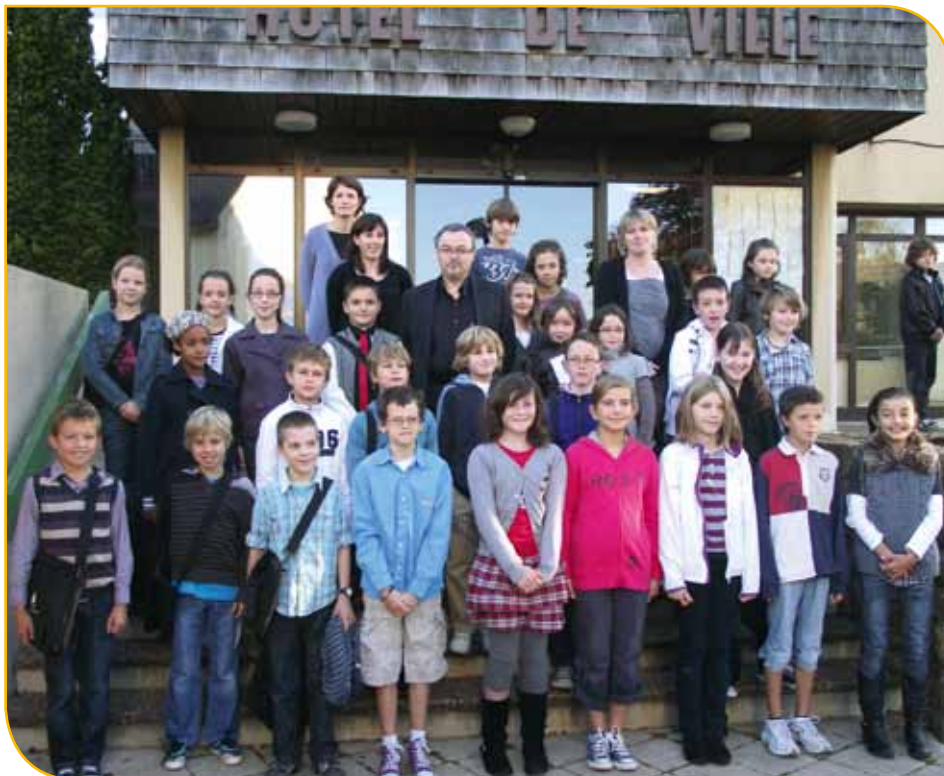
Mise en place du conseil en septembre 2011